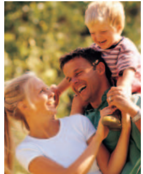
DIGNISSIM QUI BLAN DIPT ATUM DELENIT

Et iusto odio dignissim qui blandit praesent luptatum zzril delenit augue duis dolore te feugait nulla facilisi. Lorem ipsum dolor sit amet, consectetur adipiscing elit, sed diam nonummy nibh euismod tincidunt ut laoreet dolore magna aliquam erat volutpat. Ut wisi enim ad minim veniam, quis exerci tation ullamcorper suscipit lobortis nisl ut aliquip ex ea commodo consequat.